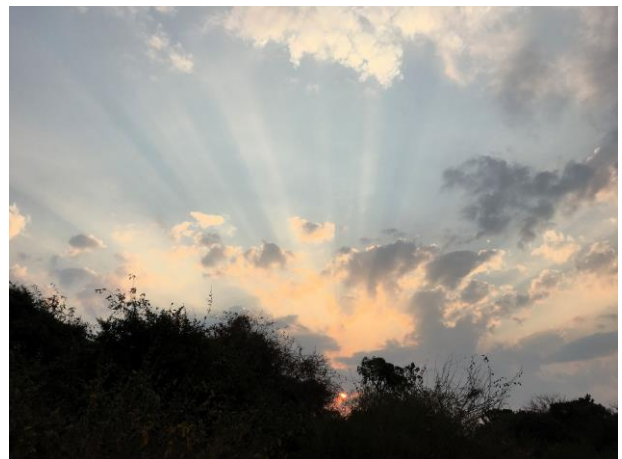
Sonnenuntergang am Malawisee

Wir kehren mit einer Fülle von positiven, aber auch von sehr nachdenklich stimmenden Eindrücken nach Hause zurück. In Erinnerung wird uns aber vor allem die Fröhlichkeit und herzliche Freundlichkeit der Menschen in Malawi bleiben, dem warmen Herzen Afrikas.