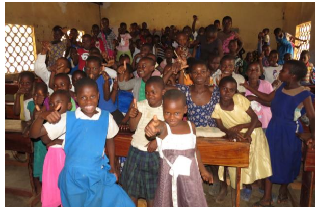
Schülerinnen in einem Schulraum mit den von uns zur Verfügung gestellten Schulmöbeln

Die Klassengröße liegt bei 100 – 120 Schülerinnen; die Klassenzimmer sind fast leere Räume, in den die SchülerInnen auf dem Boden sitzen. Die von uns im Rahmen des Projektes zur Verfügung gestellten Schulmöbel und Geräte stellen daher für den Schulbetrieb und insbesondere die Arbeit im Jugendzentrum eine große Erleichterung dar.