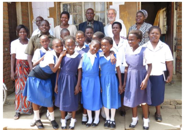
Gruppenbild mit der sogenannten peer-group

Bei unserer Ankunft werden wir vom Schulleiter und den im Jugendzentrum tätigen LehrerInnen und Schülerinnen, der sogenannten peer-group, herzlich mit Gesang begrüßt und durch die Schule geführt. Wir erhalten einen guten Einblick in die Zusammensetzung der peer-group und den Stand unseres erst wenige Monate alten Projektes.