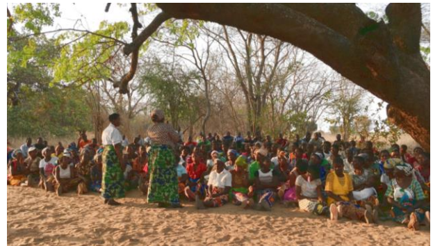
Die Krankenschwester im Gespräch über Familienplanung und Frauenrechte

Sodann besuchen wir mehrere Aufklärungs- und Informationsveranstaltungen mit jeweils einigen hundert TeilnehmerInnen, bei denen wir einen sehr detaillierten und äußerst positiven Einblick in die Arbeit des IIWD vor Ort und über das Interesse und die Beteiligung der Bevölkerung an unseren Projekten gewinnen.