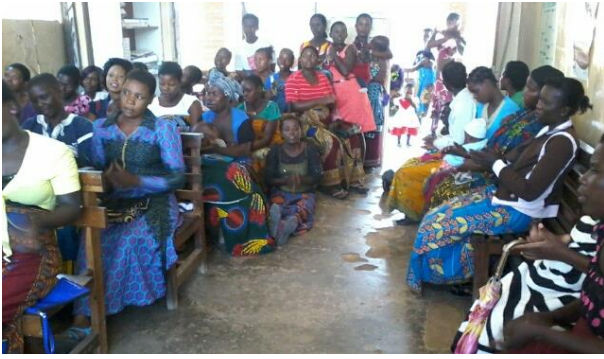
Frauen, die am KDH auf Behandlung warten

In der Mutter-Kind-Station warten viele Dutzend Frauen mit ihren Kindern auf dem Rücken stundenlang auf eine Behandlung. Für die meisten ist das Krankenhaus nur zu Fuß zu erreichen, oftmals über eine Entfernung von vielen Kilometern.