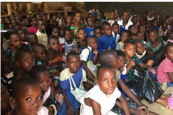
Schülerinnen der St. Mary´s Girl Primary School, im Klassenzimmer am Boden sitzend

Die Klassengröße liegt bei 100 – 120 Schülerinnen; die Klassenzimmer sind fast leere Räume, in den die SchülerInnen auf dem Boden sitzen. Die von uns im Rahmen des Projektes zur Verfügung gestellten Schulmöbel und Geräte stellen daher für den Schulbetrieb und insbesondere die Arbeit im Jugendzentrum eine große Erleichterung dar.