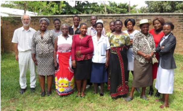
Gruppenbild mit den MitarbeiterInnen des IIWD

In Karonga lassen wir uns vom IIWD über den Stand unserer Projekte im Detail unterrichten.