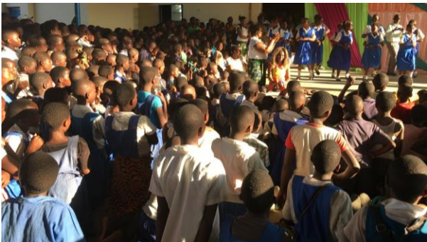
Auftritt der Mädchen der peer-group

Anwesend sind neben Vertretern verschiedener Regierungs- und Nicht-Regierungs-Organisationen auch ca. 25 Chiefs (vergleichbar unseren Bürgermeistern) der umliegenden Gemeinden. Ihre Unterstützung ist besonders wichtig, da die Mobilisierung der Bevölkerung für unsere Projekte schwerpunktmäßig über die Chiefs läuft. Die Reden und Vorträge, die vor allem das zentrale Thema des Jugendzentrums, sexuelle Gesundheit, sowie alle damit zusammenhängenden Fragenstellungen wie Familienplanung, Frauenrechte und die Folgen der fortschreitenden Bevölkerungsexplosion ansprechen, werden begleitet von traditionellen Tänzen und Gesängen.